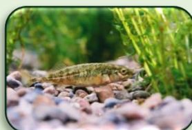
清流のシンボル 「ムサシトミヨ」